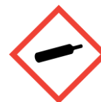
Symboles ADR (Pictogrammes de danger)