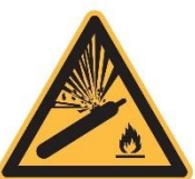
Signal de danger