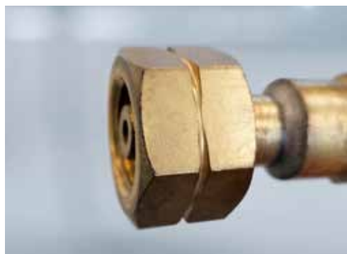
Anschlussmutter für Brenngase mit Nut

Bei Brenngas-Flaschen weisen die unterschiedlichen Anschlüsse ein Linksgewinde auf. Bei allen anderen Gasflaschen besitzen die unterschiedlichen Anschlüsse ein Rechtsgewinde .