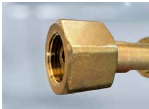
Anschlussmutter für andere Gase ohne Nut

Bei Brenngas-Flaschen weisen die unterschiedlichen Anschlüsse ein Linksgewinde auf. Bei allen anderen Gasflaschen besitzen die unterschiedlichen Anschlüsse ein Rechtsgewinde .